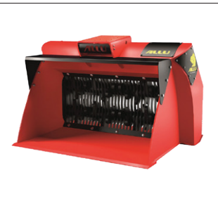
Hydraulická preosievacia lyžica