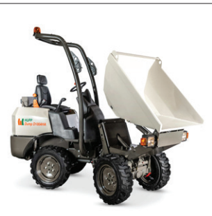
HUPPDump D100 AHA